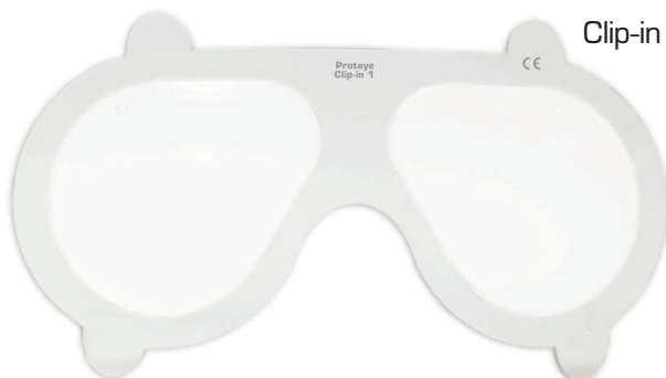
Clip-in met correctieglazen