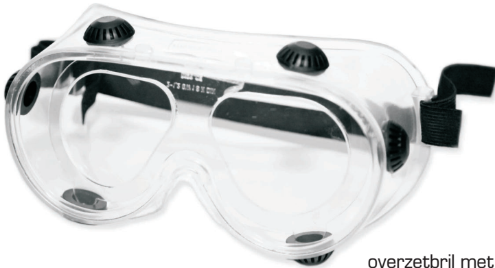
overzetbril met correctie clip-in

De clip-in is geschikt voor Proteye correctieglazen en kan makkelijk in de bril worden gezet. Komt standaard met anti-condensdoekje. Ontspiegeling is eveneens mogelijk.