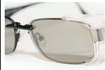
Polarisation clip-on voor model 029