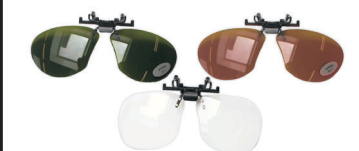
Flip-ups (voorhangers) leverbaar met diverse filters