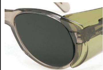
lasfilter met correctie (vlak) en gekleurde zijkapjes