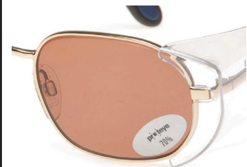
Bruin 70% zonnefilter